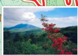
宝篋山頂から見える筑波山

注意 宝篋山は水郷筑波国定公園区域です。自然公園法に基づく第2種、第3種特別地域に指定され、各種行為が規制されています。また、コースや園地以外は国有林または民有地となりますので、許可なく立入りはできません。